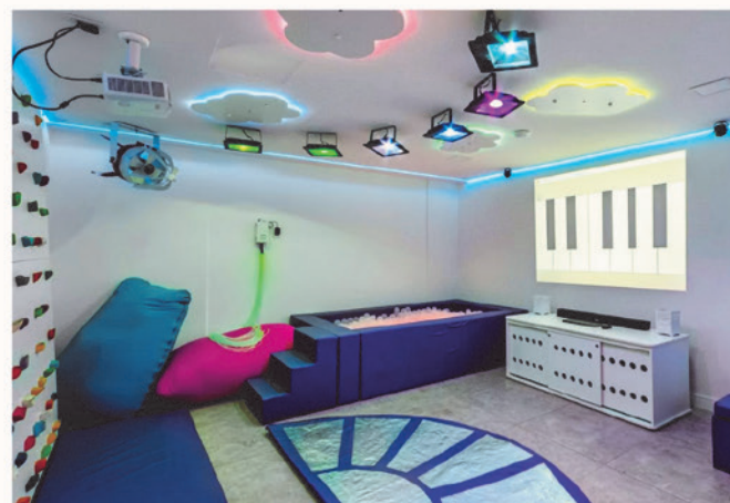
... que continuam mudando a realidade das pessoas”. 1ª sala multidisciplinar sensorial da APAE em MS.